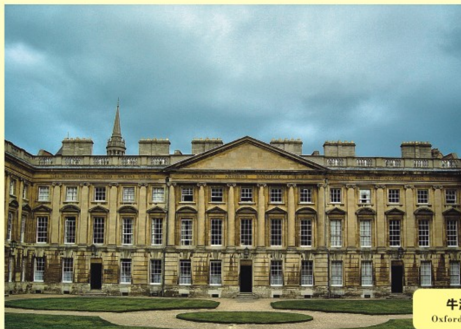
牛津大学 Oxford University