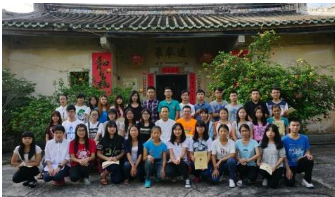
汕头大学至诚书院第十期“中国传统文化学习营”合影